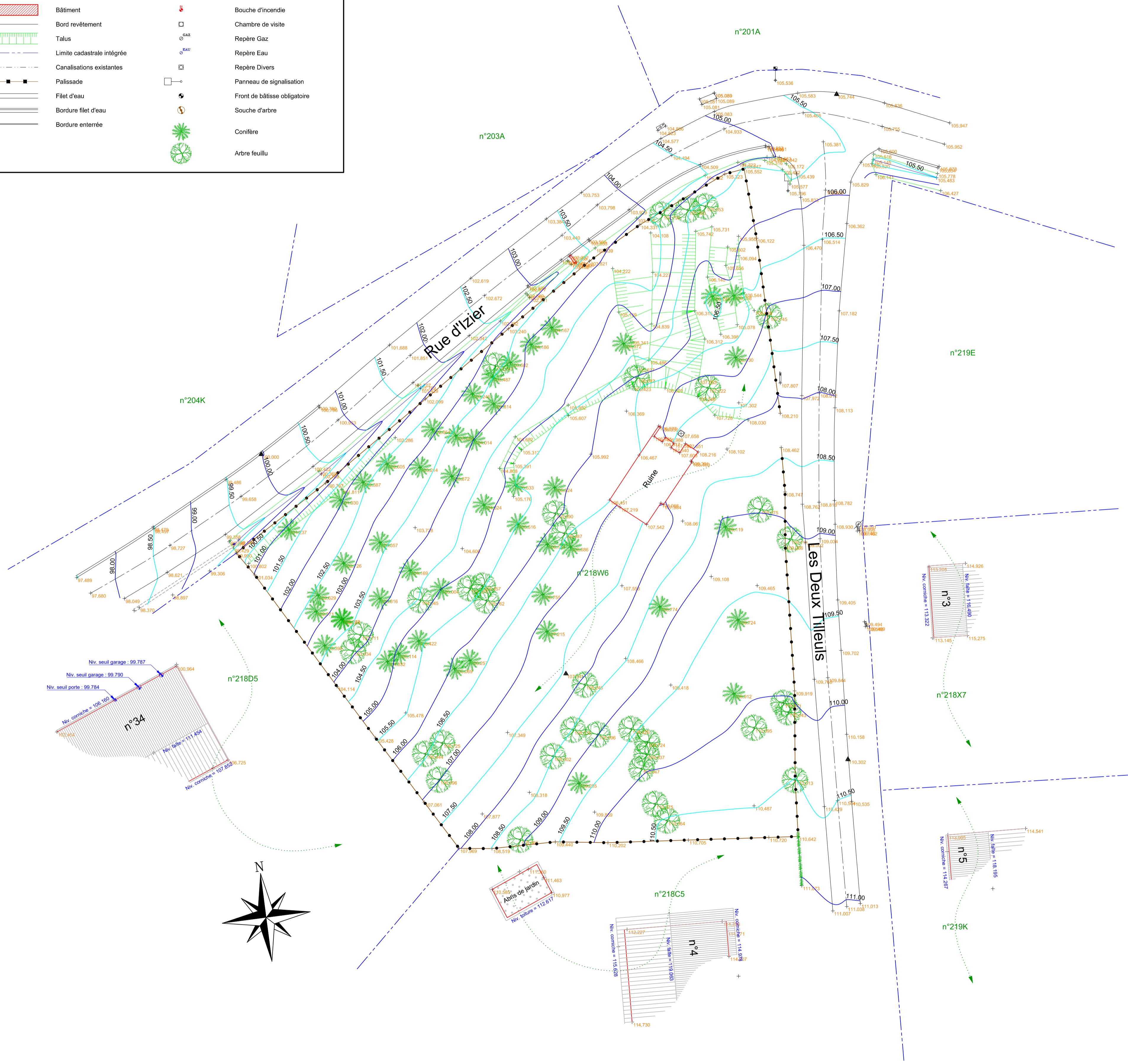
Plan de situation (échelle 1/2500)